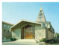
PIAZZA PASCOLI - VISERBA

La Parrocchia Santa Maria di Viserba Mare in collaborazione con Missio presentano